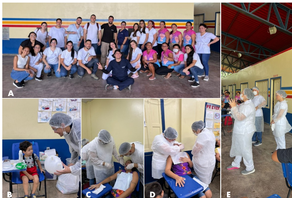
Figura 1 - Visita técnica ao município a fim de realizar uma varredura no local onde seriam realizadas as ações junto aos membros da comunidade (líder comunitário e ACSs) (A-C), atendimentos clínicos realizados e atividades de educação em saúde (D-E)

O outro local escolhido para realizar as atividades, foi na Igreja Assembleia de Deus localizada na Av.Noel Nutels , 511 , Cidade Nova 2 em Manaus, Amazonas. O ambiente conta com um amplo espaço interno composto por um térreo onde foi realizada a triagem (Figura 3) e o 1º piso onde foram realizados os procedimentos, assim como um banheiro onde foram realizadas as escovações supervisionadas e instruções de saúde bucal feitas pelos alunos. O público, em sua grande maioria, eram crianças e os procedimentos executados foram: extrações e restaurações simples (ART), raspagem supragengival, além de escovação supervisionada e aplicação de flúor, que foram realizados nas próprias cadeiras de plástico disponibilizadas pela igreja (Figura 2 A-B).