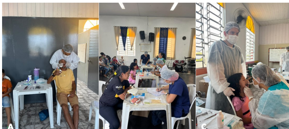
Figura 3 - Triagem e atendimentos clínicos realizados (A-C)

O total e o tipo de procedimentos realizados em cada local estão detalhados na tabela abaixo (Tabela 1).